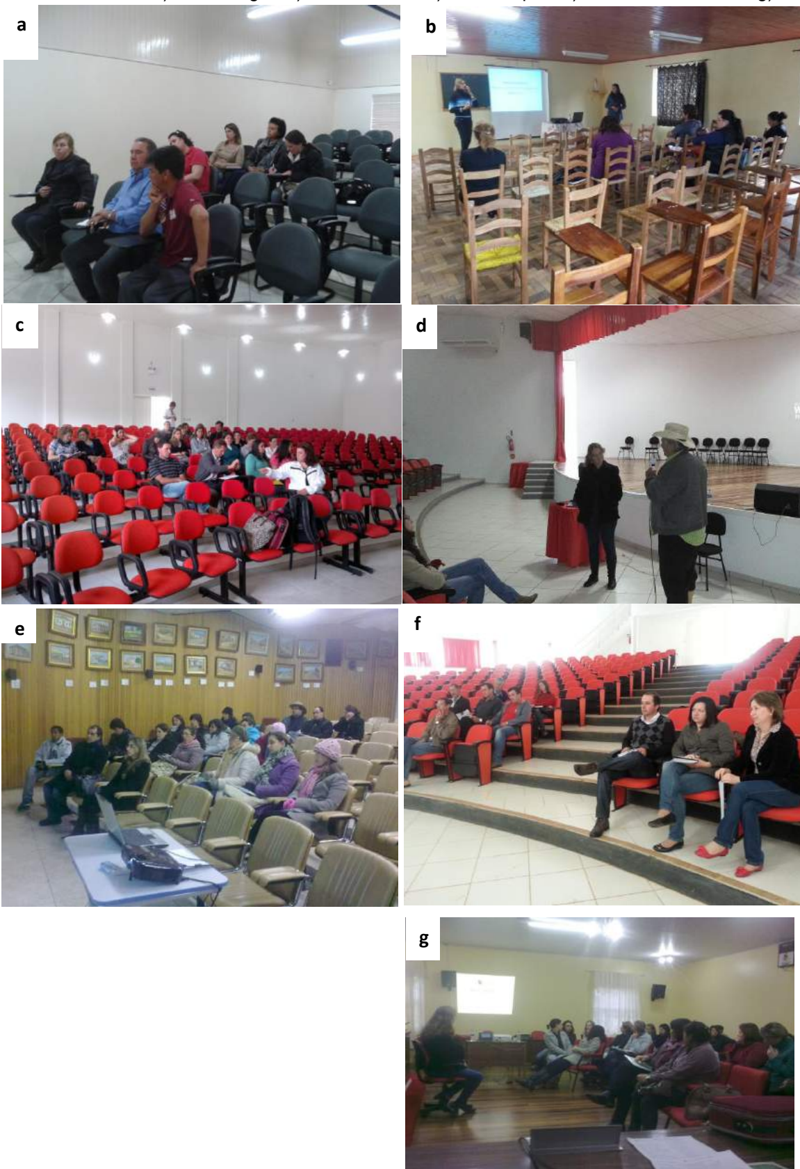
Figura3 –Curso de capacitação voltado aos professores dos municípios. a) Anita Garibaldi; b) Bom Jardim da Serra; c) Cerro Negro; d) Correia Pinto; e) São Joaquim; f) São José do Cerrito; g) Urubici;