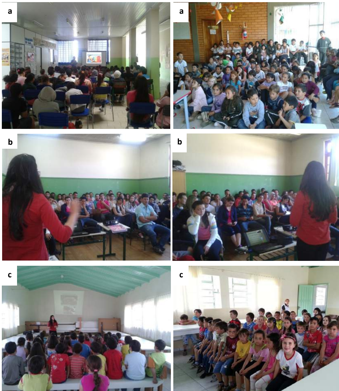
Figura 4 –Mobilizações realizadas nas escolas dos municípios. a) Capão Alto - Escola Municipal Rural Valmor Antunes dos Santosb) Painei - Escola de Educação Básica Padre Antônio; c) Painei - Escola de Educação Básica Santo Antônio; d) Palmeira - Escola Básica Antonieta Silveira.