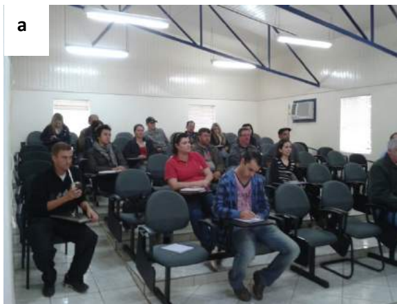
Figura 2 –Mobilizações voltadas à comunidade realizadas nos municípios.a) Anita Garibaldi; b) Bocaina do Sul; c) Bom Jardim da Serra; d) Cerro Negro; e) Correia Pinto; f) Painei; g) Ponte Alta; h) Rio Rufino;i) São Joaquim; j) São José do Cerrito; l) Urupema.