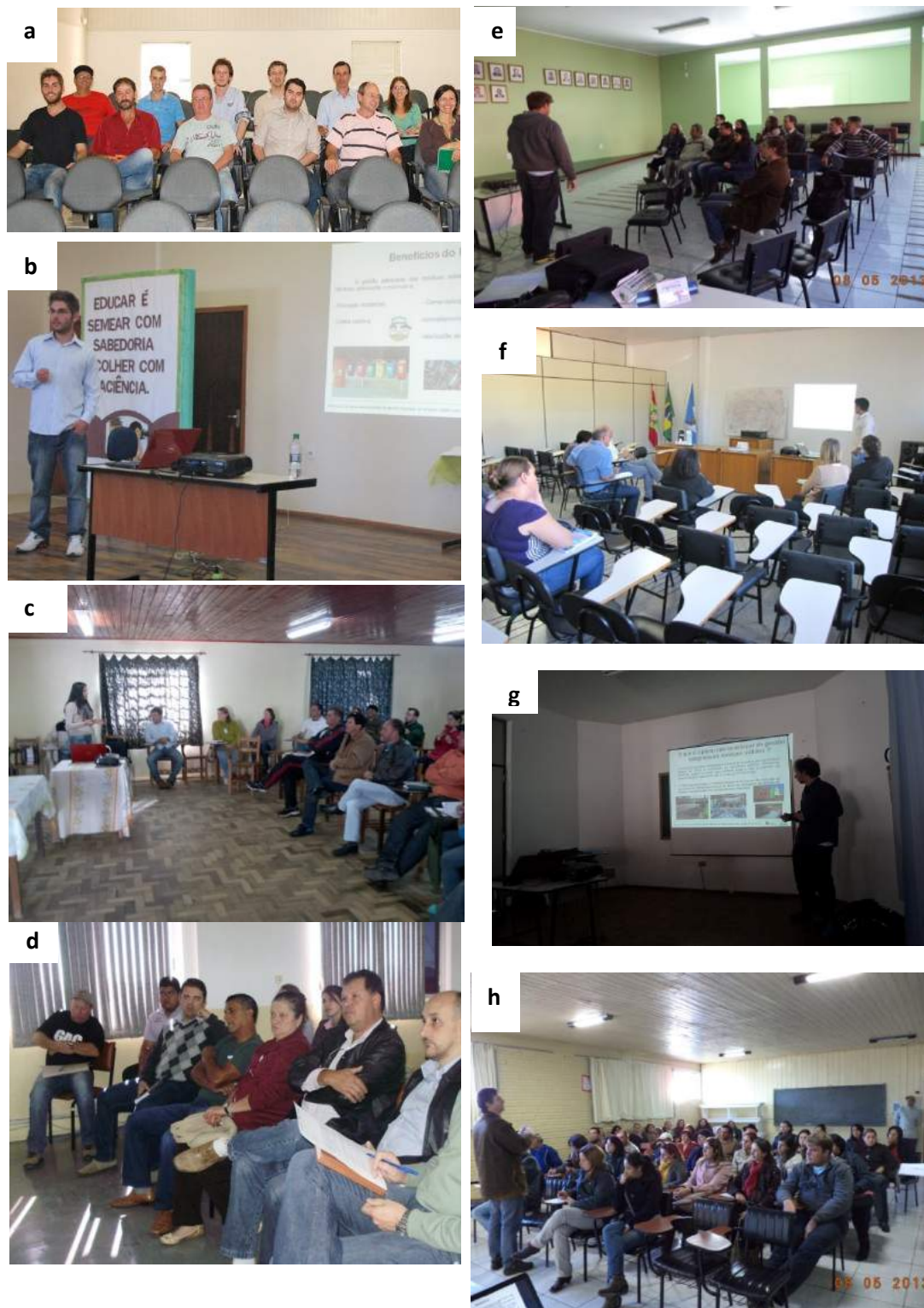
Figura 1—Audiências com setores dos municípios. a) Anita Garibaldi; b) Bocaina do Sul; c) Bom Jardim da Serra; d) Otacílio Costa; e) Painel; f) Rio Rufino; g) Urubici; h) Urupema;