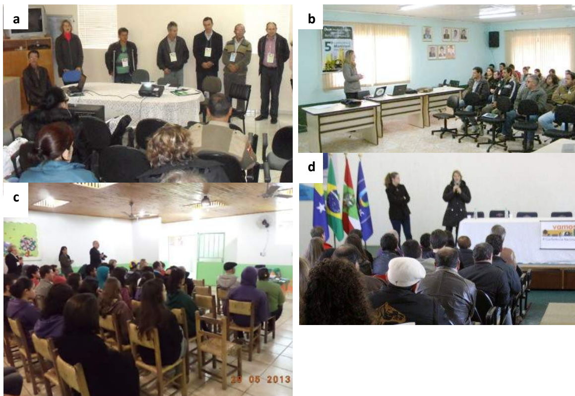
Figura 5: Participação em conferências. a) Anita Garibaldi; b) Cerro Negro; c) Ponte Alta; d) Lages.